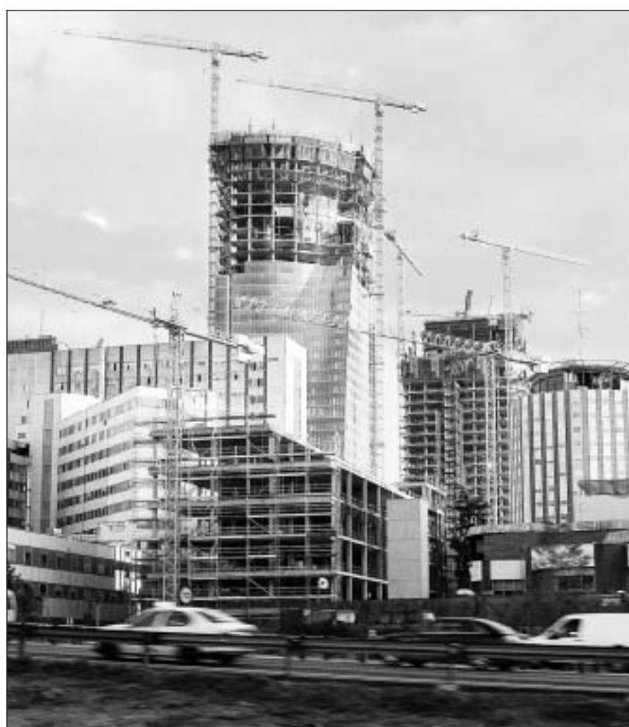
Durch die rege Bautätigkeit sind in Spanien viele Arbeitsplätze geschaffen worden. Doch diese Entwicklung hat sich nun gewendet.

Die Immobilienentwickler, die sich auf dem Höhepunkt des Baubooms im Jahr 2006 noch mit überdimensionierten Projekten oder Übernahmen hoch verschuldeten und den spanischen Finanzinstituten 300 Mrd. € schulden, sind entweder bereits in Konkurs gegangen oder hoffen angesichts der Kreditklemme auf eine staatliche Finanzspritze: Rund 40 Mrd. € bräuchte der Wirtschaftszweig nach Einschätzung der Lobby-Gruppe G 14, der vierzehn grössten Immobiliengesellschaften, um eine gewisse Bautätigkeit aufrechtzuerhalten. Für dieses Jahr rechnet G 14