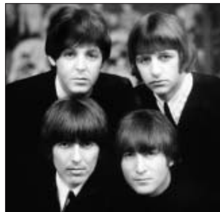
Liverpool will mehr als die Geburtsstadt der Pilzköpfe sein.

Armselig sind in Liverpool nicht nur viele Hotels, sondern ganze Quartiere. Rund um die Uni gibt es Strassen, in denen kaum noch ein Haus bewohnt ist. Um Vandalen fernzuhalten, sind viele Fenster verbarrikadiert. Liverpool zählt mit knapp 440 000 Einwohnern nur noch halb so viele Einwohner wie zur Blütezeit im 19. Jahrhundert. Von den rund 300 000 Liverpoolern im erwerbsfähigen Alter sind 26% langzeitarbeitslos, 13% invalid oder krankgeschrieben und 5% auf Stellensuche.